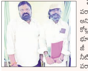
మర్రిగూడ, ఏప్రిల్ 26, ప్రభాతవార్త:

తెలంగాణ రాష్ట్ర సాధనలో ప్రకృతిని పర్యావరణాన్ని కాపాడడానికి నేనున్నాను అని ముందుకు వచ్చి, తన 70 ఏకరాల కోట్ల రూపాయల విలువచేసే వ్యవసాయ భూమిని అడవిగా మార్చి నోరులేని మూగ జీ వాలకు, పక్షులకు అడవిలో ఆహారం నీటి వసతి కల్పించిన అపార భగీరథుడు, పర్యావరణ ప్రేమికుడు, జలసాధన సమితి